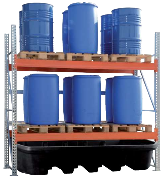
PE-B 13.27, Artikel-Nr. P70-2046-A, in ein Palettenregal integriert

Regal-Bodenwanne ohne Gitterrost für Feldweite in mm