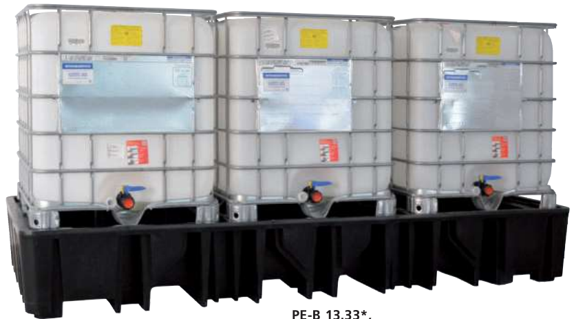
PE-B 13.33*, ohne PE-Lochplatte, Artikel-Nr. P70-2047-A

Unser komplettes Sortiment an Auffangwannen aus PE finden Sie ab Seite 33!