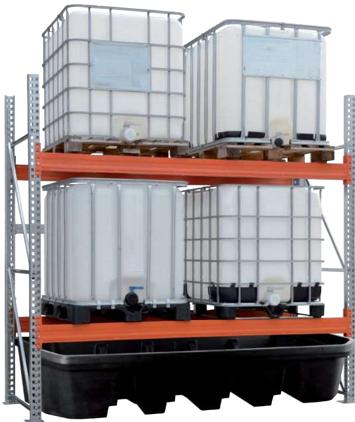
PE-B 13.27, Artikel-Nr. P70-2046-A, in ein KTC-Regal integriert