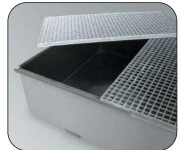
Ausführung mit PE-Einsatz