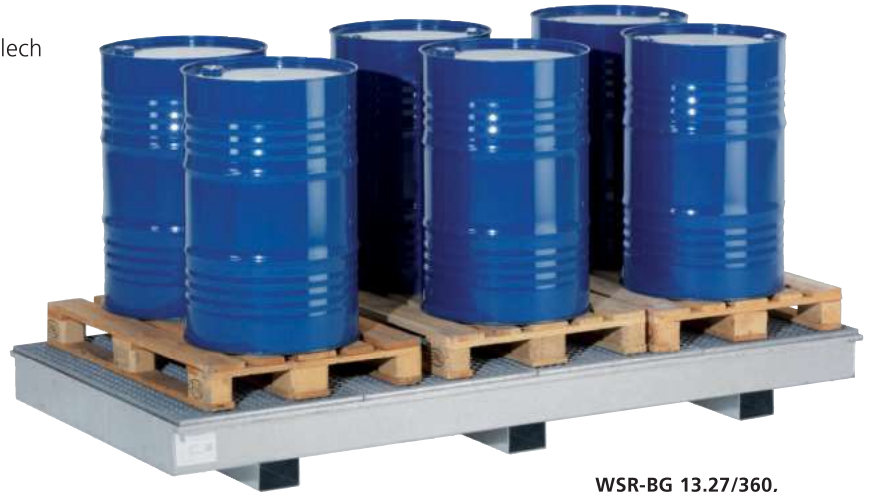
WSR-BG 13.27/360, Artikel-Nr. R23-1902-F