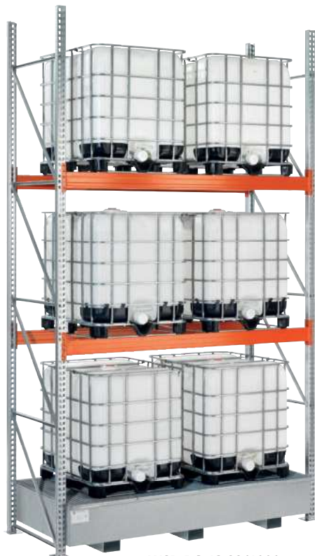
WSR-BG 13.22/1000, Artikel-Nr. R23-1904-F, in ein KTC-Regal integriert