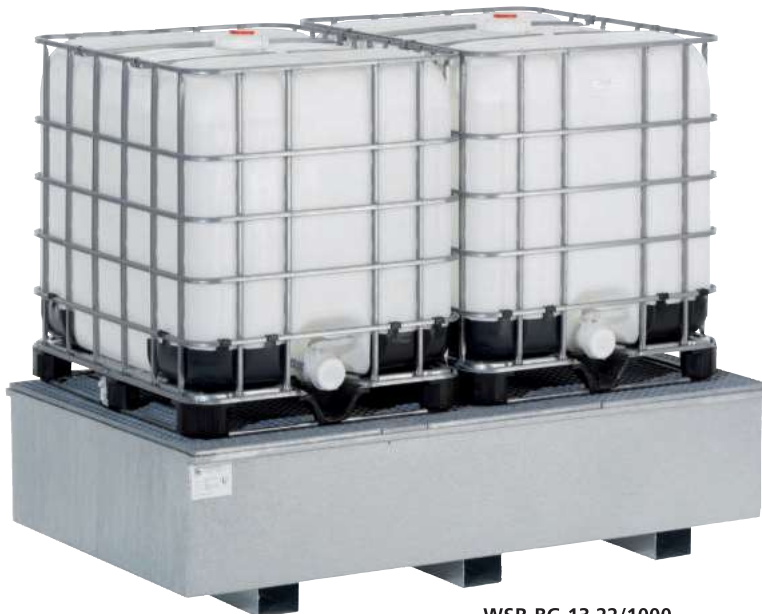
WSR-BG 13.22/1000, Artikel-Nr. R23-1904-F

Bei Ausstattung mit Gitterrost kann die Regalbodenwanne auch als 1. Lagerebene genutzt werden.