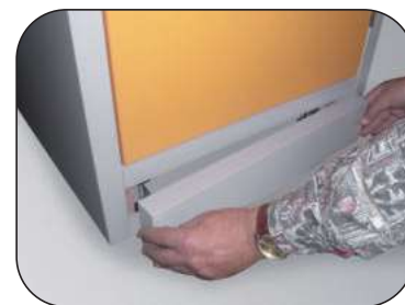
Inkl. Sockel, mit abnehmbarer Blende