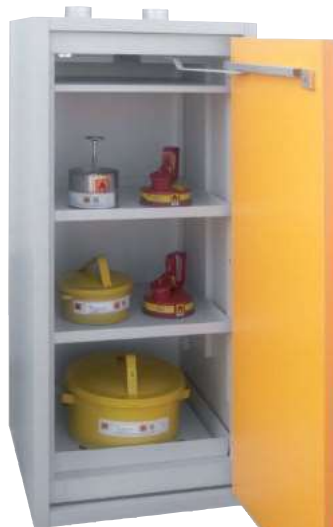
SiS Typ 30 / 600-1300, Artikel-Nr. B80-2608-A, Tür RAL 1007 - narzissengelb, inkl. 2 Einlegeböden, Bodenwanne und Lochblechabdeckung