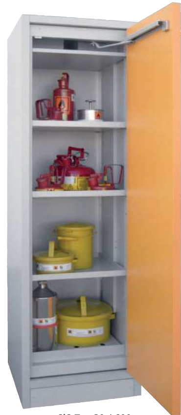
SiS Typ 30 / 600, Artikel-Nr. B80-2603-A, Tür RAL 1007 - narzissengelb, inkl. 3 Einlegeböden, Bodenwanne und Lochblechabdeckung