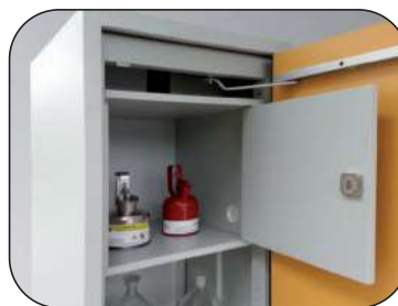
Schließfach, SF Typ 30/600, Artikel-Nr. B80-2660-A, Abmessungen: B x T x H in mm = 480 x 518 x 422,5