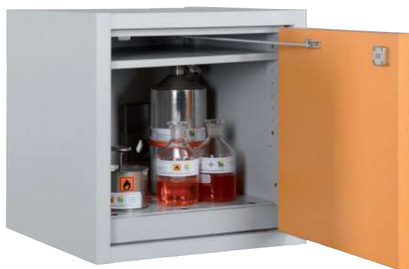
AUS Typ 30 / 600 FT, Tür RAL 1007, Artikel-Nr. B80-2640-A