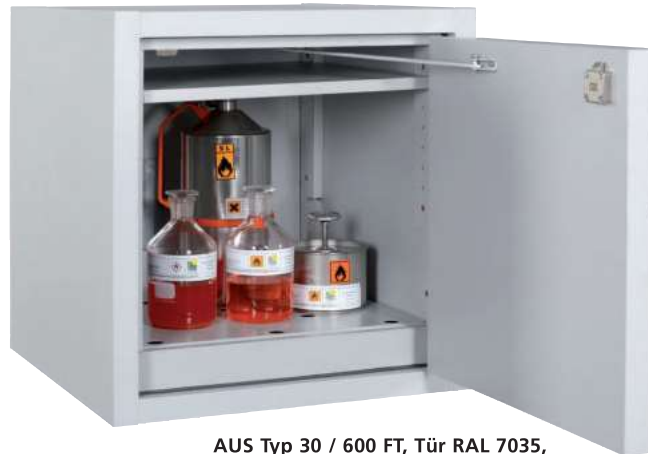
AUS Typ 30 / 600 FT, Tür RAL 7035, Artikel-Nr. B80-2639-A