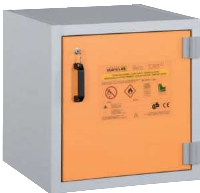
AUS Typ 30 / 600 FT, Tür RAL 1007, Artikel-Nr. B80-2640-A