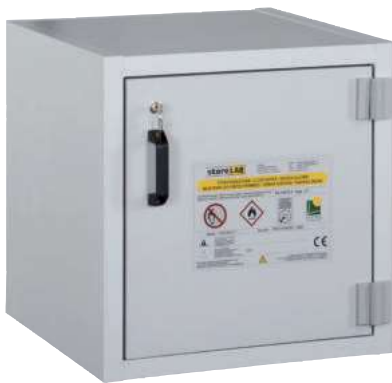
AUS Typ 30 / 600 FT, Tür RAL 7035, Artikel-Nr. B80-2639-A

Abluftventilatoren finden Sie auf Seite 138!