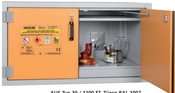
AUS Typ 30 / 1100 FT, Türen RAL 1007, Artikel-Nr. B80-2609-A