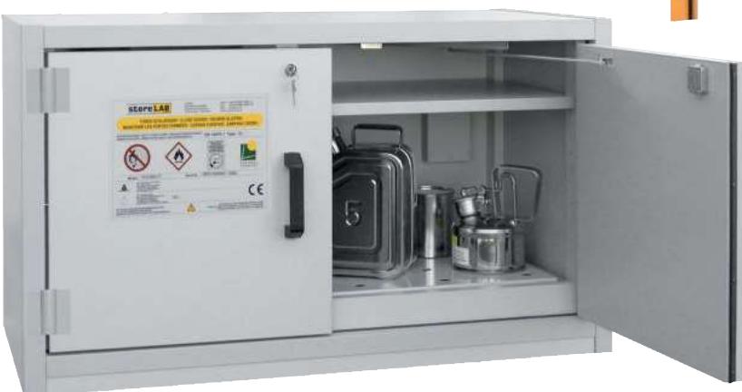
AUS Typ 30 / 1100 FT, Türen RAL 7035, Artikel-Nr. B80-2602-A