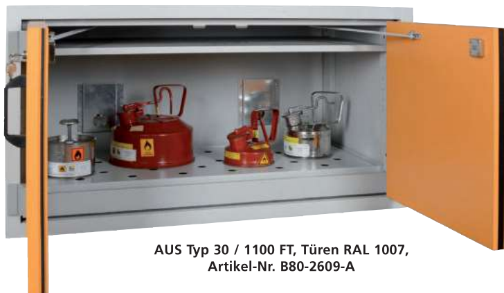
AUS Typ 30 / 1100 FT, Türen RAL 1007, Artikel-Nr. B80-2609-A