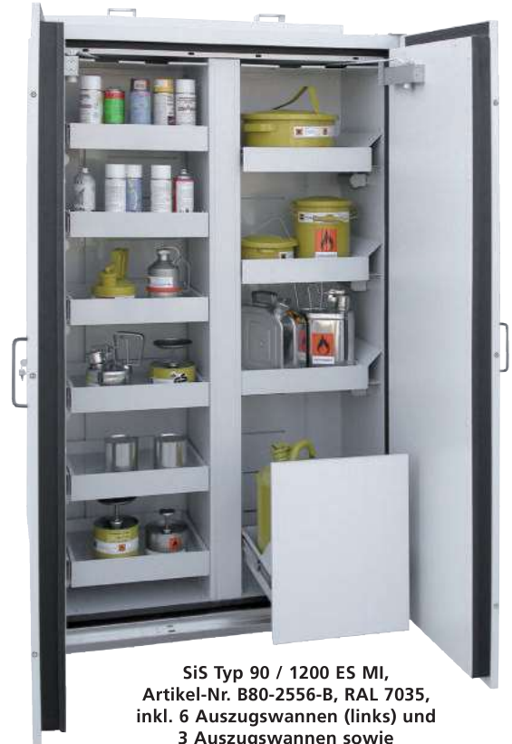
Sis Typ 90 / 1200 ES MI, Artikel-Nr. B80-2556-B, RAL 7035, inkl. 6 Auszugswannen (links) und 3 Auszugswannen sowie 1 Entsorgungsfach (rechts)