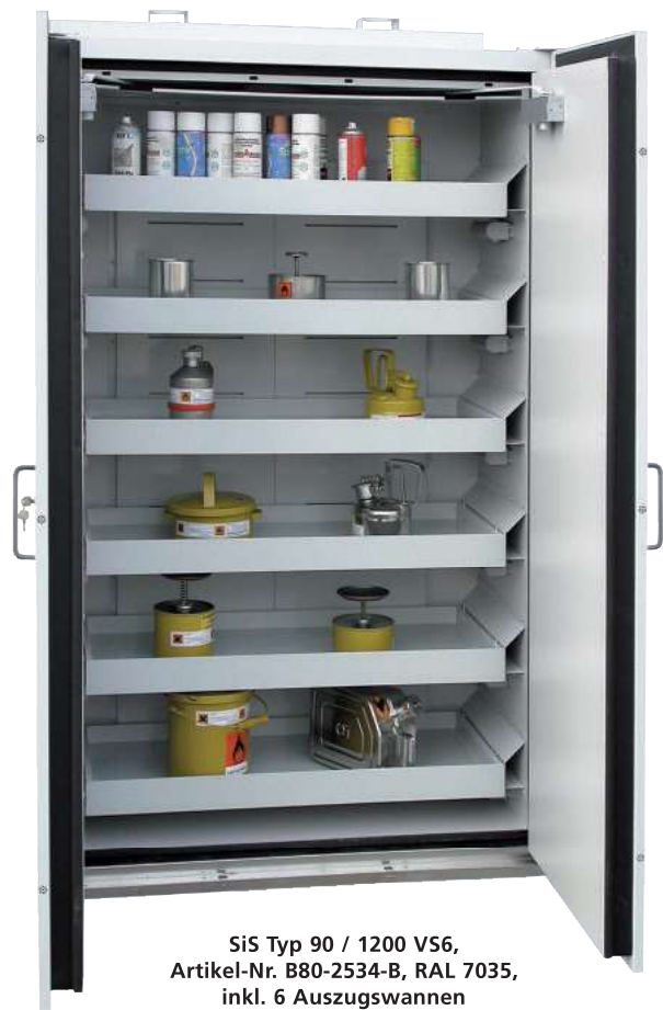
Sis Typ 90 / 1200 VS6, Artikel-Nr. B80-2534-B, RAL 7035, inkl. 6 Auszugswannen