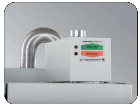
Montagebeispiel Modell 8