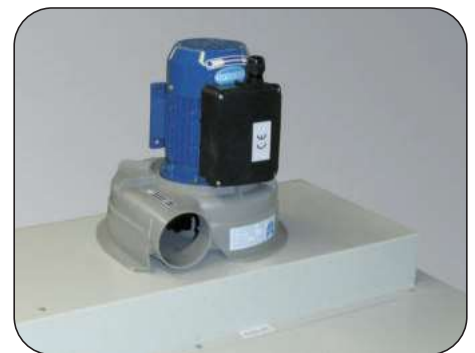
Montagebeispiel Modell 1 + 3 + 9