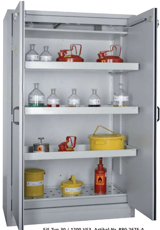
SiS Typ 30 / 1200 VS3, Artikel-Nr. B80-2675-A, Türen RAL 7035 - lichtgrau, inkl. 3 Auszugswannen