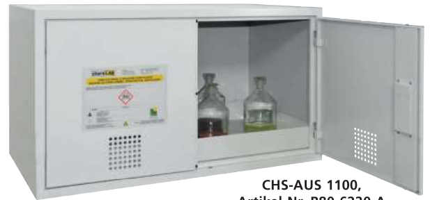
CHS-AUS 1100, Artikel-Nr. B80-6220-A