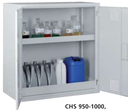
CHS 950-1000, Artikel-Nr. B80-6122-A