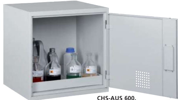
CHS-AUS 600, Artikel-Nr. B80-6223-A