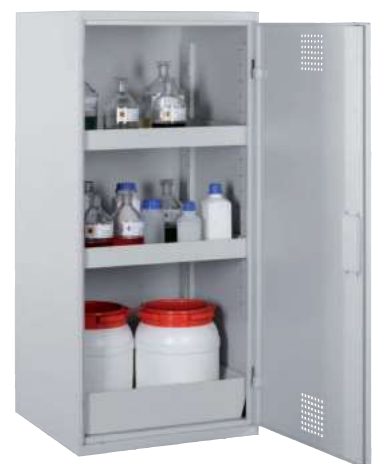
CHS 600-1300, Artikel-Nr. B80-6133-A