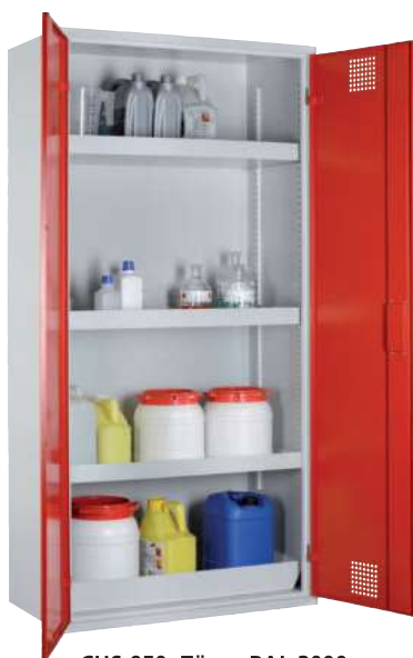
CHS 950, Türen RAL 3000 Artikel-Nr. B80-6169-A