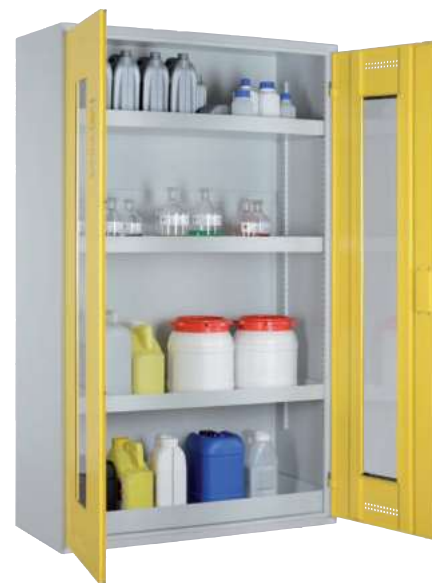
CHS 1200 GL, Türen RAL 1018 Artikel-Nr. B80-6189-A