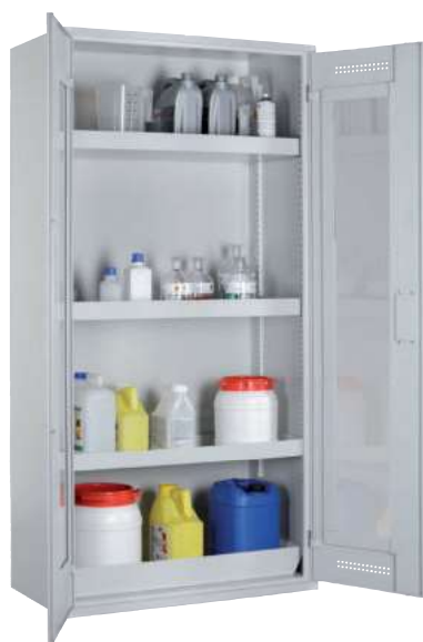
CHS 950 GL, Türen RAL 7035 Artikel-Nr. B80-6216-A