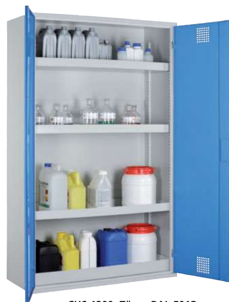
CHS 1200, Türen RAL 5015 Artikel-Nr. B80-6171-A