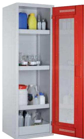
CHS 600 GL, Tür RAL 3000 Artikel-Nr. B80-6180-A