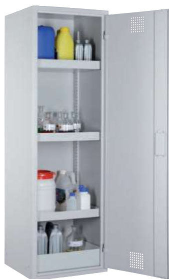
CHS 600, Tür RAL 7035 Artikel-Nr. B80-6134-A