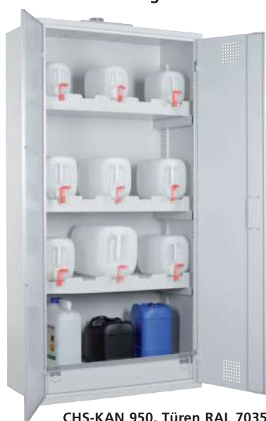
CHS-KAN 950, Türen RAL 7035 Artikel-Nr. B80-6233-A