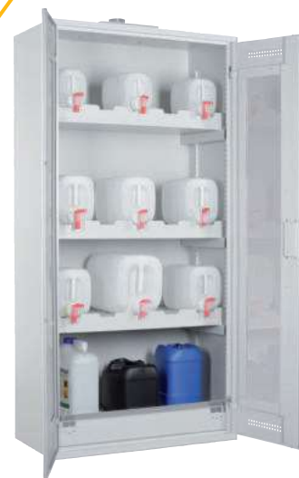
CHS-KAN 950 GL, Türen RAL 7035 Artikel-Nr. B80-6234-A