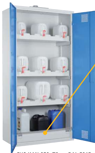
CHS-KAN 950, Türen RAL 5015 Artikel-Nr. B80-6458-A