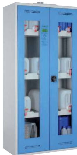
CHS-KAN 950 GL, Türen RAL 5015 Artikel-Nr. B80-6463-A