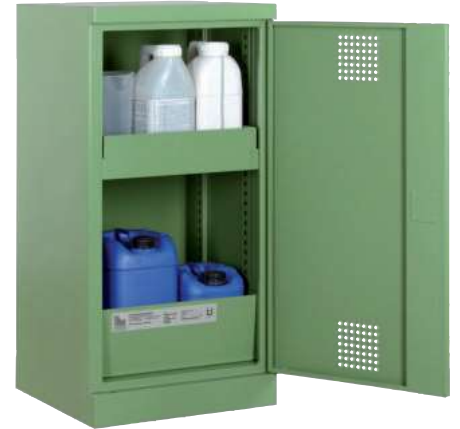
PSM 500-1000, Artikel-Nr. B80-6110-A