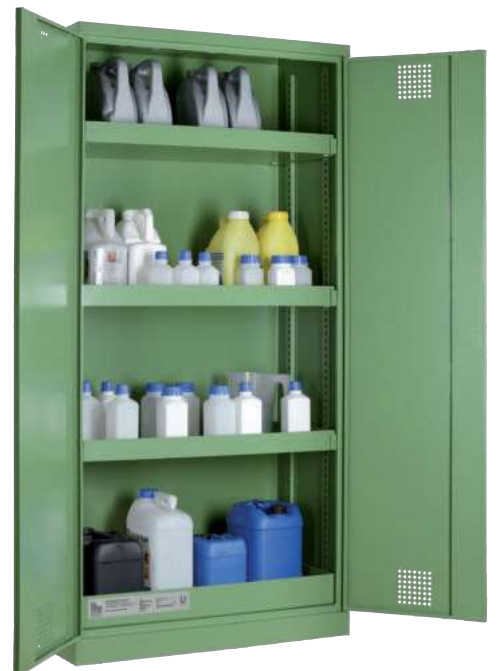
PSM 950, Artikel-Nr. B80-6113-A