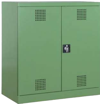
PSM 950-1000, Artikel-Nr. B80-6112-A