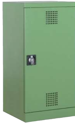
PSM 500-1000, Artikel-Nr. B80-6110-A