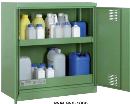
PSM 950-1000, Artikel-Nr. B80-6112-A