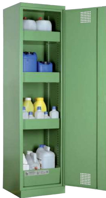
PSM 500, Artikel-Nr. B80-6111-A