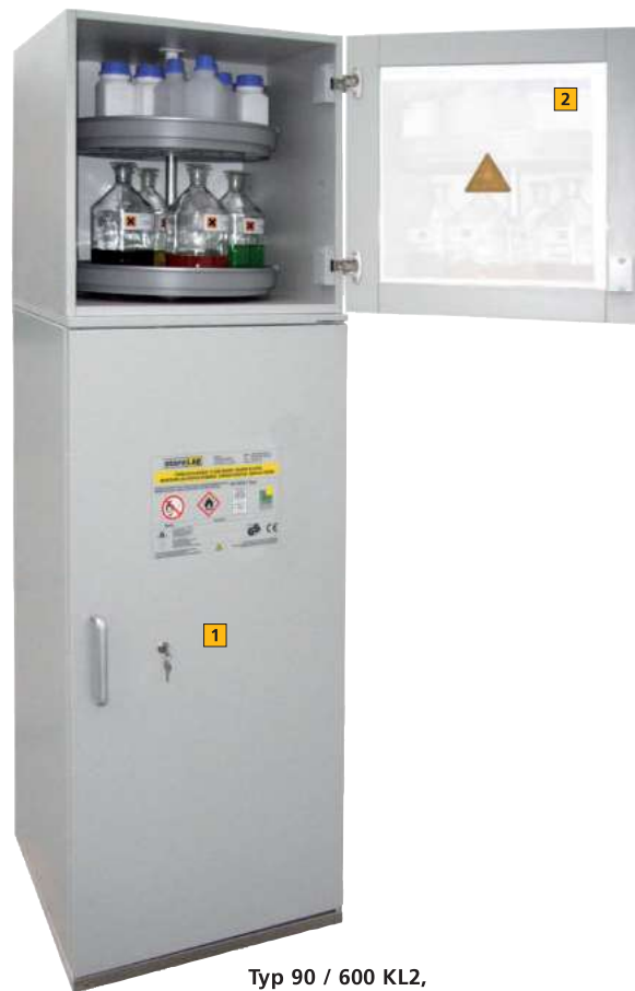
Typ 90 / 600 KL2, Artikel-Nr. B80-2889-A