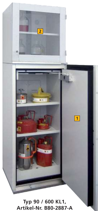
Typ 90 / 600 KL1, Artikel-Nr. B80-2887-A