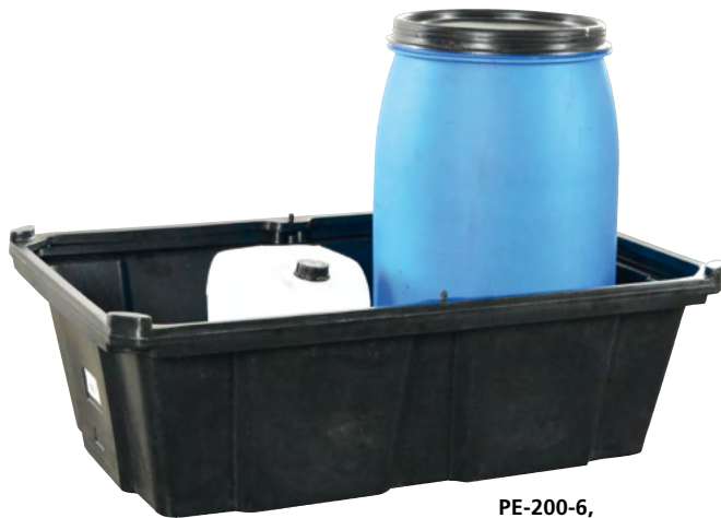
PE-200-6, ohne Stellebene, Artikel-Nr. P70-2028-A