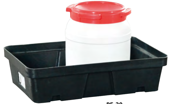
PE-20, ohne Stellebene, Artikel-Nr. P70-2002-A