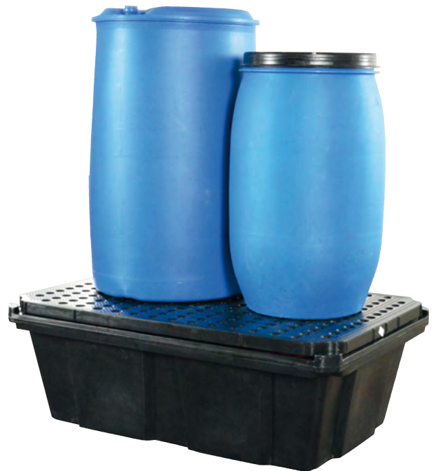
PE-200-6, mit PE-Lochplatte, Artikel-Nr. P70-2029-A