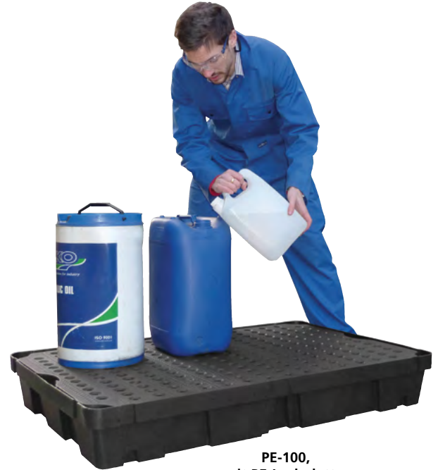
PE-100, mit PE-Lochplatte, Artikel-Nr. P70-2009-A