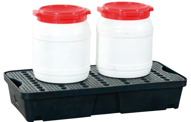
PE-30, mit PE-Lochplatte, Artikel-Nr. P70-2003-A