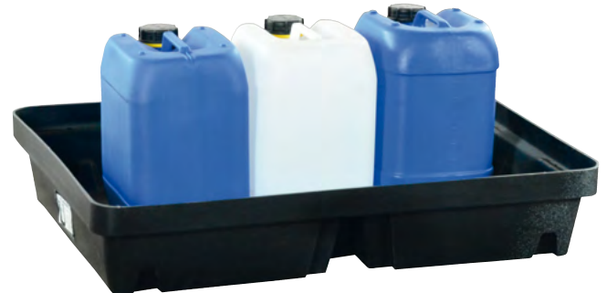
PE-40, ohne Stellebene, Artikel-Nr. P70-2006-A