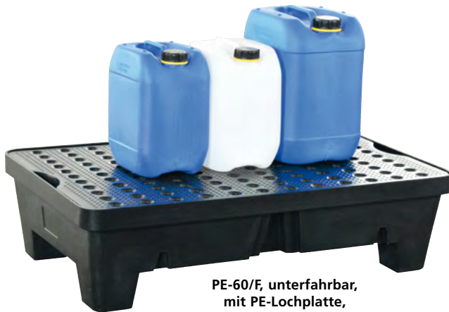
PE-60/F, unterfahrbar, mit PE-Lochplatte, Artikel-Nr. P70-2013-A