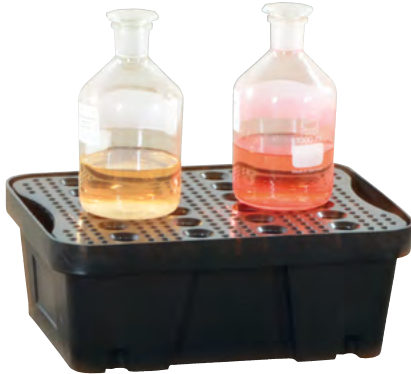
PE-10, mit PE-Lochplatte, Artikel-Nr. P70-2011-A