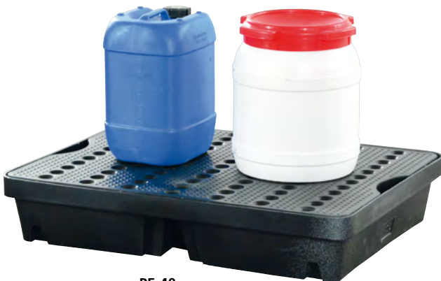
PE-40, mit PE-Lochplatte, Artikel-Nr. P70-2005-A