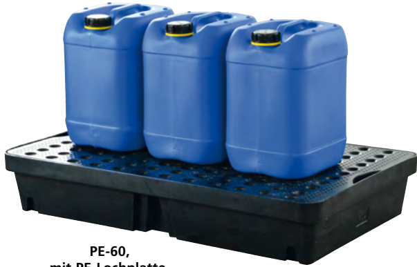
PE-60, mit PE-Lochplatte, Artikel-Nr. P70-2007-A