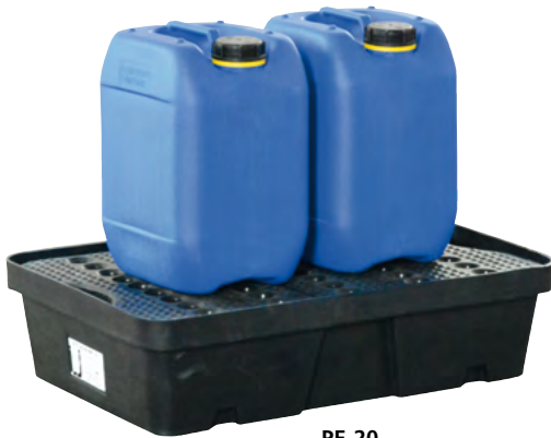
PE-20, mit PE-Lochplatte, Artikel-Nr. P70-2001-A