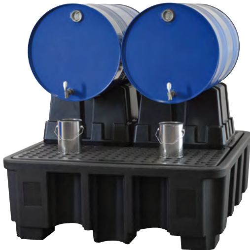
FB 2-Kombi, Artikel-Nr. P70-2033-A, z.B. 2x 200-Liter-Fass

i Auffangwannen sind nicht im Lieferumfang enthalten!