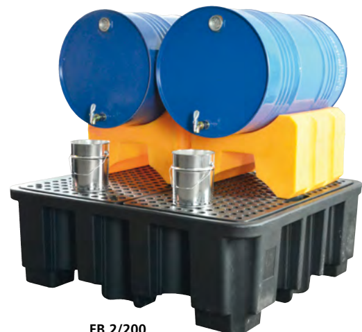
FB 2/200, Artikel-Nr. P70-7114-A