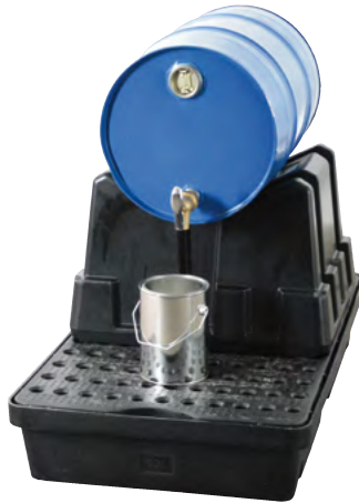
FB 1-Kombi, mit 60-Liter-Fass, Artikel-Nr. P70-2031-A

Bei Nichtnutzung ist der Fassbock platzsparend stapelbar!