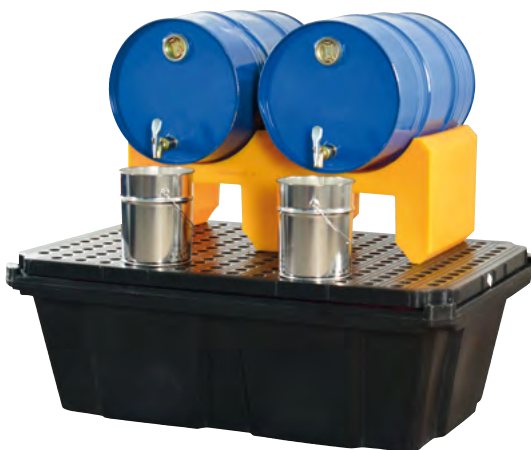
FB 2/60, Artikel-Nr. P70-7113-A