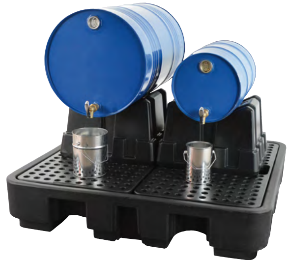
FB 2-Kombi, Artikel-Nr. P70-2033-A, z.B. 1x 200-Liter-Fass und 1x 60-Liter-Fass