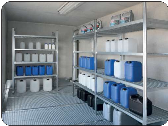
Innenausstattung mit optionalen Gefahrstoffregalen zur Lagerung von Kleingebinden