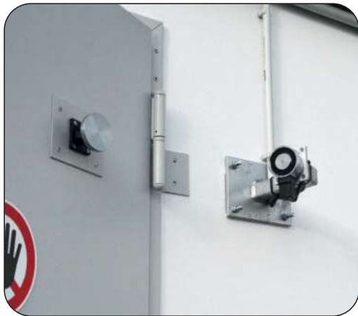
Türfeststellanlage mit allgemeiner bauaufsichtlicher Zulassung