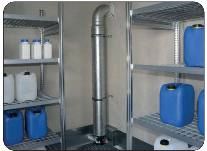
Ex-Abluftanlage inkl. Abluftkanal bis Auffangwanne