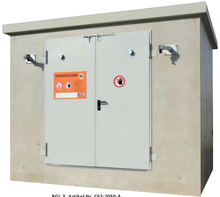
BGL 3, Artikel-Nr. C62-2050-A