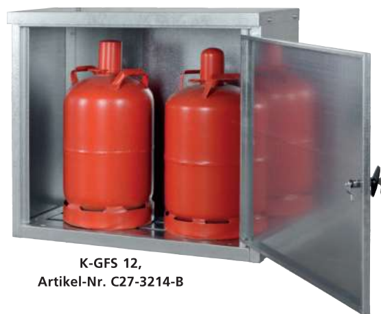
K-GFS 12, Artikel-Nr. C27-3214-B