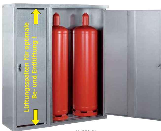
K-GFS 21, Artikel-Nr. C27-3217-B