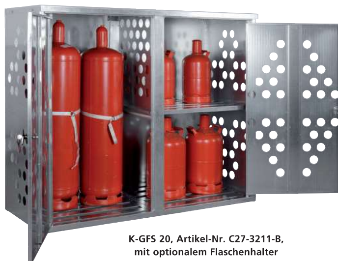
K-GFS 20, Artikel-Nr. C27-3211-B, mit optionalem Flaschenhalter