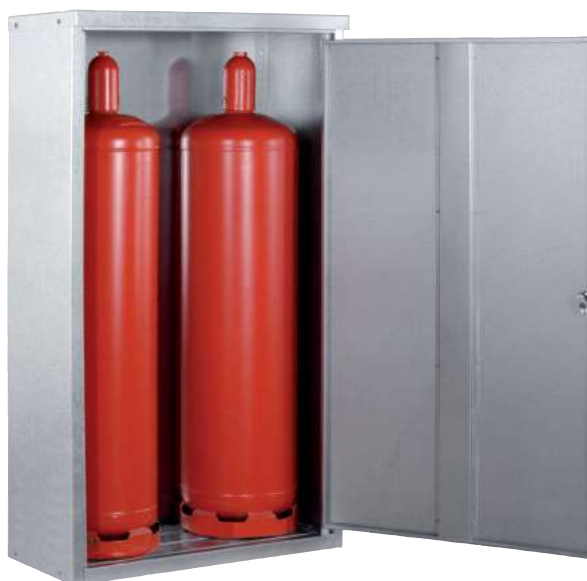
K-GFS 14, Artikel-Nr. C27-3216-B