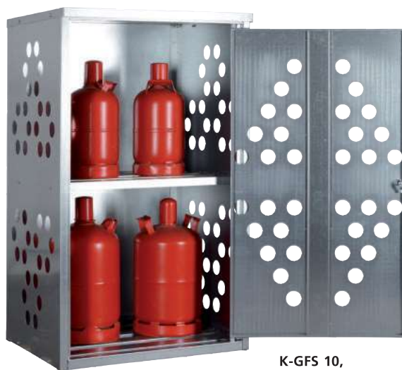
K-GFS 10, Artikel-Nr. C27-3210-B