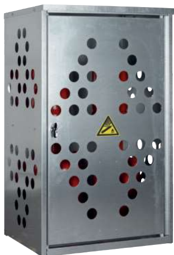
K-GFS 10, Artikel-Nr. C27-3210-B