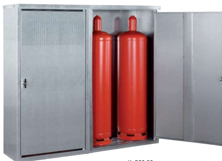
K-GFS 22, Artikel-Nr. C27-3218-B