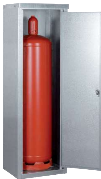
K-GFS 13, Artikel-Nr. C27-3215-B