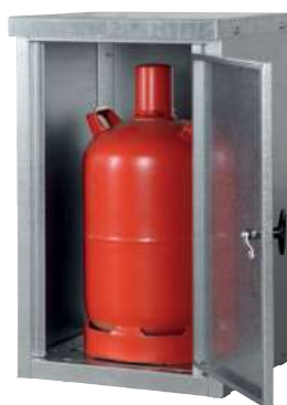
K-GFS 11, Artikel-Nr. C27-3213-B