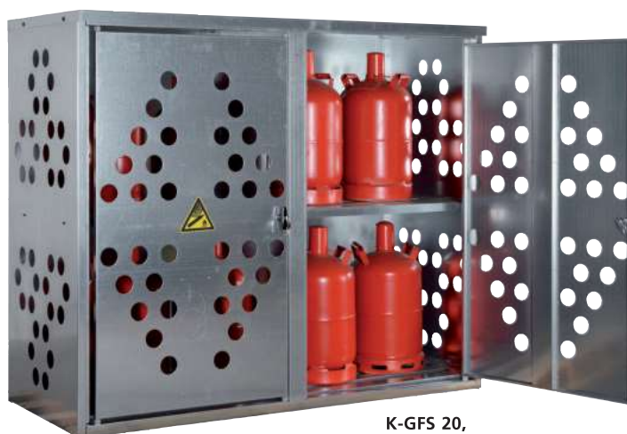
K-GFS 20, Artikel-Nr. C27-3211-B