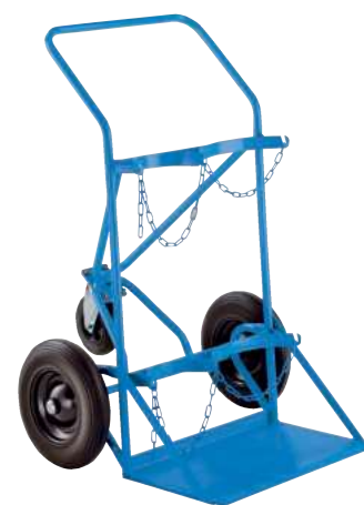
GFK2-VS, Artikel-Nr. B69-6437-A