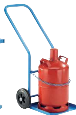
GFR27-V, Artikel-Nr. B69-6433-A