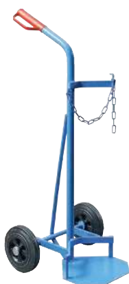
GFR40-V, Artikel-Nr. B69-6430-A