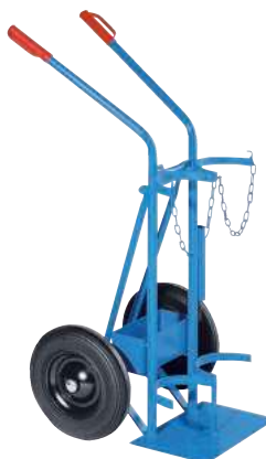
GFW50-VO, Artikel-Nr. B69-6434-A