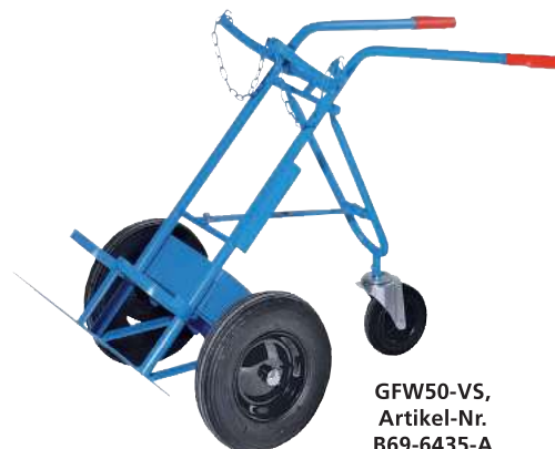
GFW50-VS, Artikel-Nr. B69-6435-A