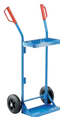
GFR10-V, Artikel-Nr. B69-6432-A