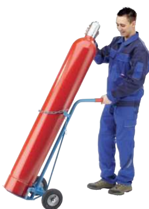
GFR40-L, Artikel-Nr. B69-6431-A